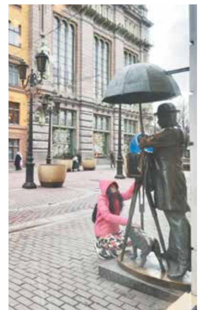
А Фотограф с собачкой остаются на месте