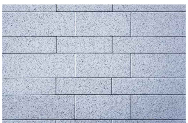
Цвет проектируемого покрытия из тротуарной плитки (сери)