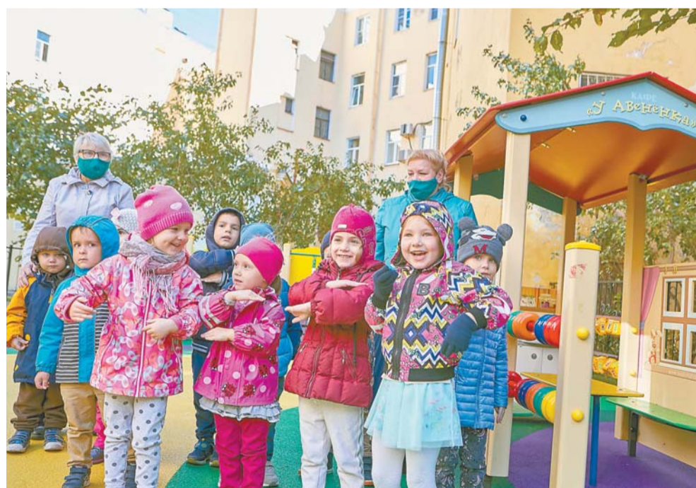
Детская площадка на Большой Конюшенной, 5

Как и полагается, не обошлось в этом сезоне и без текущих ремонтов. Так, по адресам: Большая Конюшенная улица, 5, Миллионная улица, 4/1 и 15, Волынский переулок, 5, этим летом обновили разрушенную плитку, по адресу: набережная реки Фонтанки, 5/2, — асфальт. Не остались без внимания газонные ограждения, скамейки, игровое