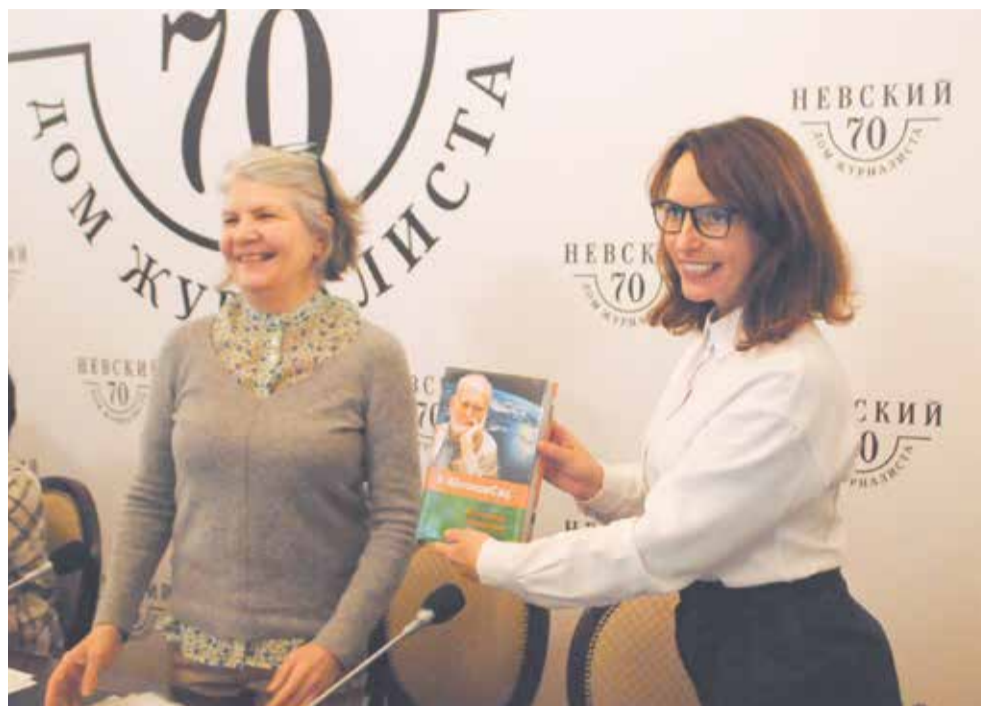
Чтения, посвященные памяти ученого, эколога, общественного деятеля Алексея Яблокова, ежегодно проходят в Петербурге. Нарботки Дворцового округа были представлены на сессии «Зеленый курс России. Циркулярная экономика».

«Батарейка» — фильм, в создании которого участвуют и молодые жители округа, и люди среднего и старшего возраста. Съёмки фильма проведены на территории Дворцового округа — на Большой Коношениной улице, на Невском проспекте. На всех этапах организаторы и кинематографисты стремились подключить жителей всех профессий и возрастов к ос-