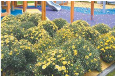
Хризантемы расцвели на Садовой

Газета внутригородского муниципального образования Санкт-Петербурга муниципальный округ Дворцовый округ