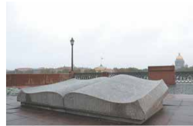
Художественные миры Эвелины Соловьевой