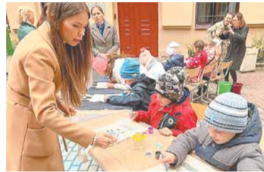
Чтобы сделать город и мысли чище