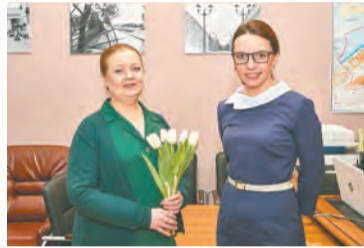
Тридцать два фуэте