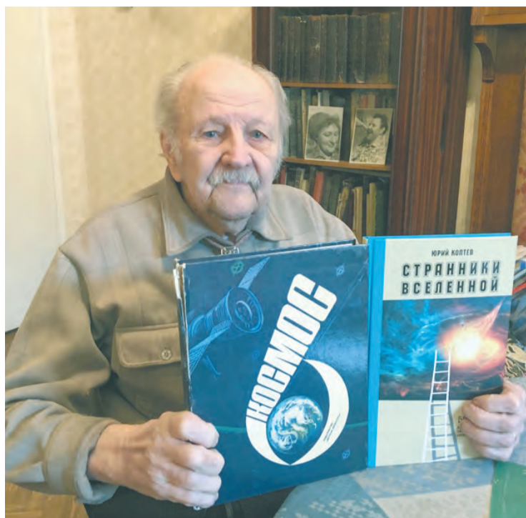
Писатель со своей книгой