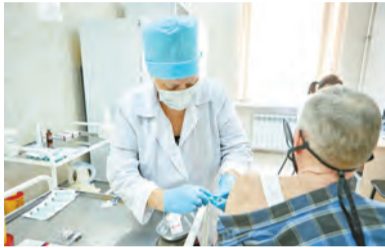
Вакцинация: ну, подумаешь, укол!

Газета внутригородского муниципального образования Санкт-Петербурга муниципальный округ Дворцовый округ