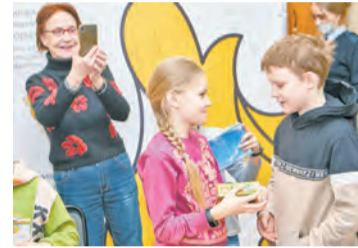
Школьники узнали о дорожных ловушках