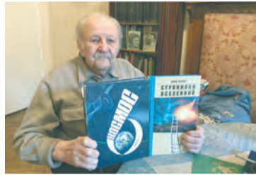
Юрий Коптев: человек-космос