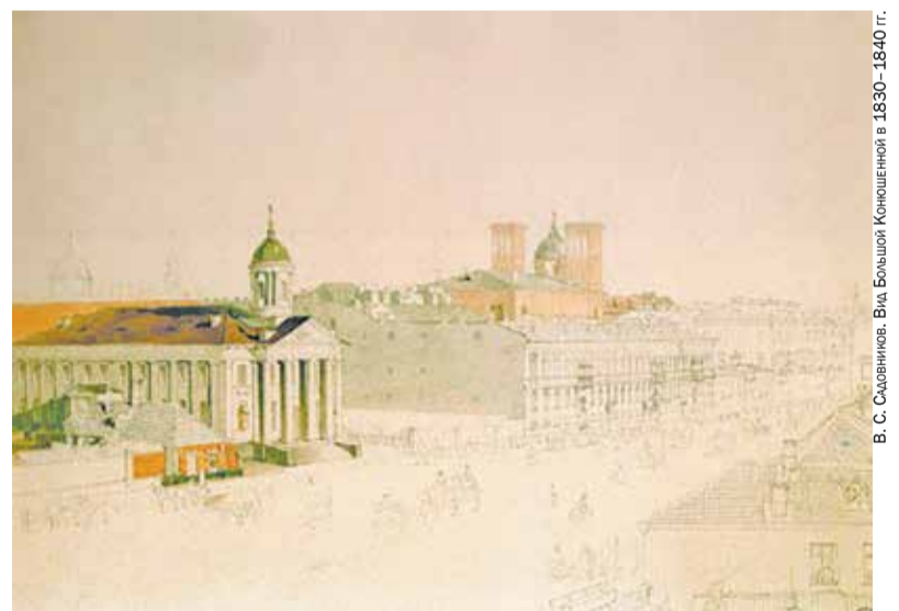
В. С. Садвинин. Вид Большой Конюшенной в 1830—1840 гг.

В середине XIX — начале XX века Большую Конюшенную улицу хотели переименовать в память об отмене крепостного