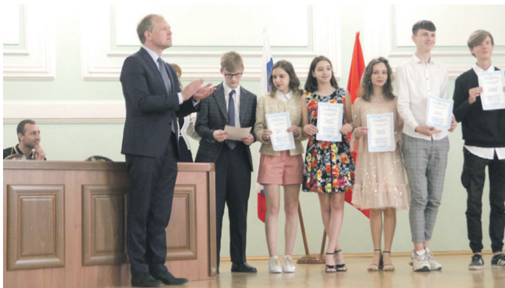
Награждение отличившихся учеников

Лариса Южанина.