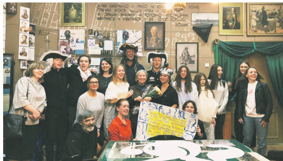
В школьном музее