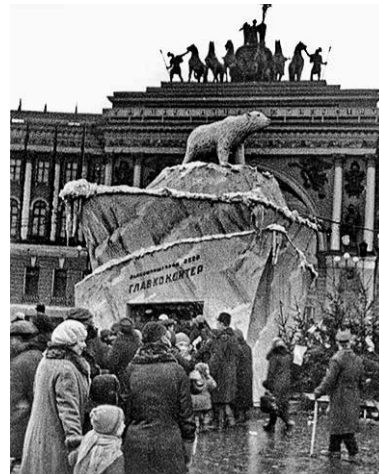
1937 год. Киоск «Главкондитер» на площади Урицкого

В 1880-х традиционным новогодним угощением становятся