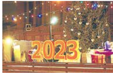
Как менялись в России новогодние обычаи