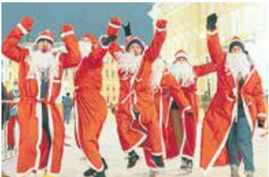
Деды Морозы пустились в пляс