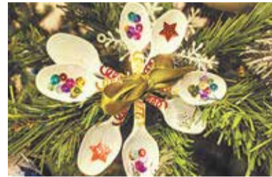
Отработанные вещи — материал для творчества