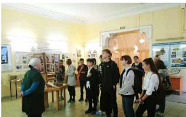
Экскурсия в музей гигиены

принимались сообщения о фактах, связанных с незаконным оборотом наркотиков и психотропных веществ.