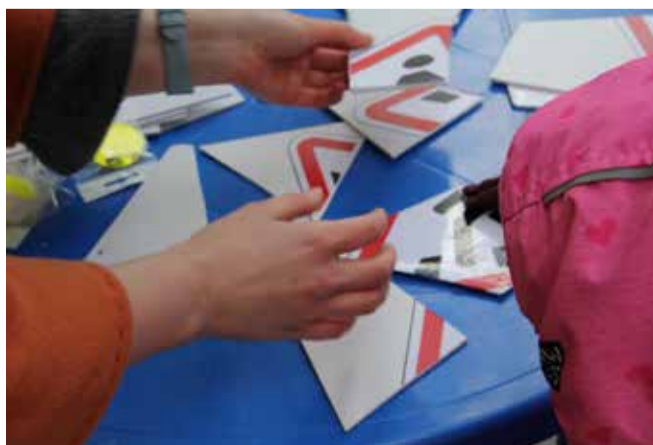
«Школа пешеходных наук»

Традиционными стали поздравления с юбилеями супружеских пар — как поддержка семейных ценностей