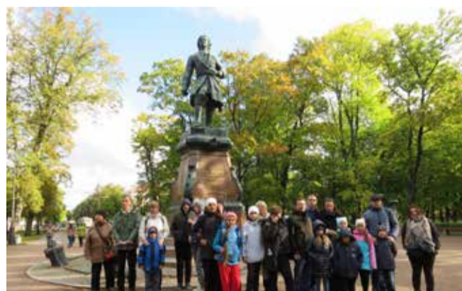
Экскурсия в г. Кронштадт

Муниципальная власть призвана решать задачи гармонизации межэтнических и межконфессиональных отношений, проводить мероприятия по предупреждению проявлений экстремизма и возникновения межнациональных (межэтнических) конфликтов, участвовать в реализации мер по сохранению и развитию языков и культуры народов Российской Федерации, укреплению гражданского единства и гармонизации межнациональных отношений многонационального российского общества.