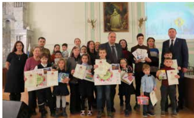
Итоги конкурса детского рисунка среди детей — жителей муниципального образования

В целом работа местной администрации и муниципального Совета внутригородского муниципального образования Санкт-Петербурга муниципальный округ Дворцовый округ по основным вопросам деятельности в 2019 году признана удовлетворительной.