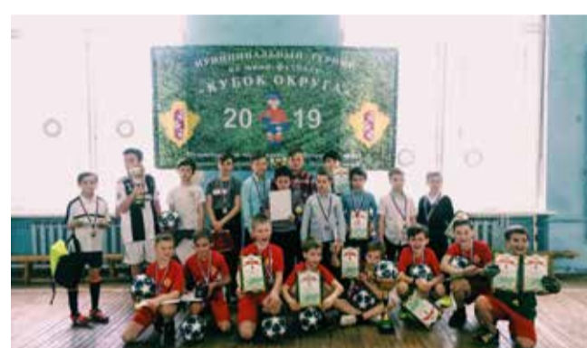
Муниципальный турнир по мини-футболу «Кубок округа»

полнении муниципальных программ и др. Тираж газеты — 3 тыс. экз.