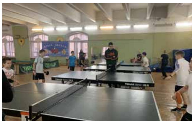
Муниципальные соревнования по настольному теннису «Кубок округа»

Мероприятия программы проводятся в целях развития муниципального спорта, укрепления здоровья и повышения физической активности, приобщения к регу-