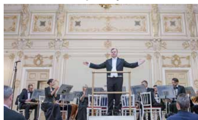
Концерт «Ленинградская победа»