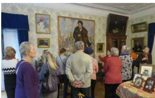
Экскурсия в Дом-музей Ф. И. Шаляпина

Глава муниципального образования, депутаты муниципального Совета, жители округа приняли участие в церемониях возложения цветов, приуроченных ко Дню полного освобождения Ленинграда от фашистской блокады, Дню Победы, Дню памяти жертв блокады. Мероприятия прошли у памятного знака «Дни блокады» на наб. реки Фонтанки, д. 21, на Невском пр., д. 14, у памятной таблички «Граждане! При артобстреле эта сторона улицы наиболее опасна», у мемориального знака «Ленинградский репродуктор» на пересечении Невского пр. и Малой Садовой ул., у мемориальной доски Первому исполнению Седьмой «Ленинградской» симфонии Д. Д. Шостаковича (Михайловская ул., д. 2).