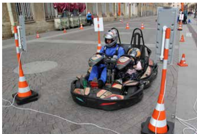
«Школа пешеходных наук»