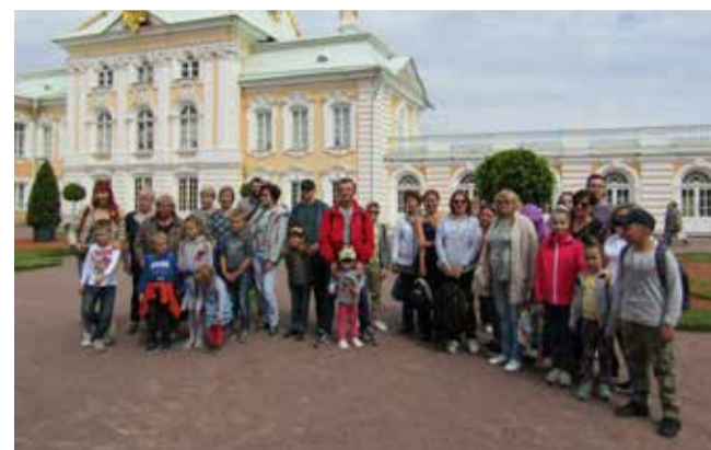
Экскурсия в г. Петергоф