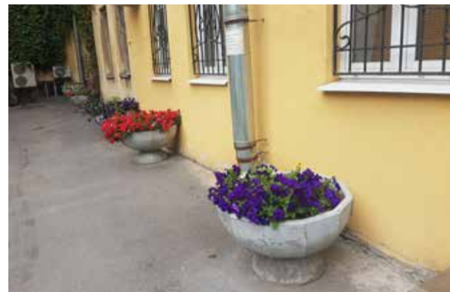
Караванная ул., д. 24-26

Мойки, д. 5, наб. реки Мойки, д. 16-18, Большой Конюшенной ул., д. 7, Малой Садовой ул., д. 3/54, на детских площадках заменены резиновые покрытия, установлено новое игровое оборудование. По адресу: Конюшенный пер., д. 1/6, резиновое покрытие и игровое оборудование замены не потребовало, оно было отремонтировано.