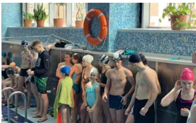
Муниципальные соревнования по плаванию «Кубок округа»

• 17 апреля в бассейне СК «Локомотив» прошли лично-командные муниципальные соревнования по плаванию «Кубок округа — 2019» в четырех возрастных категориях.