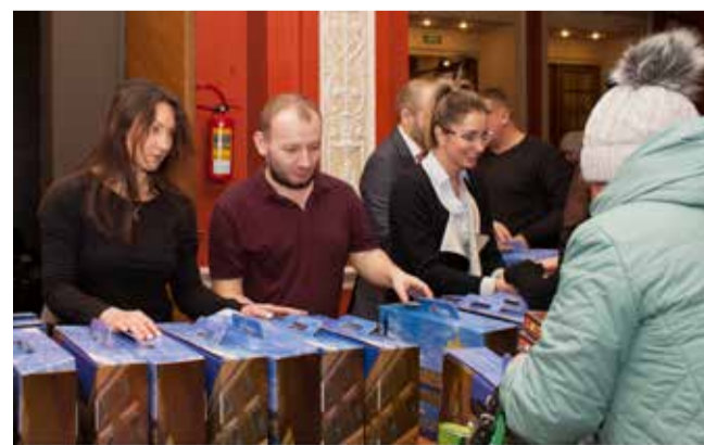
Концерт к Международному дню инвалидов. Выдача подарочных наборов