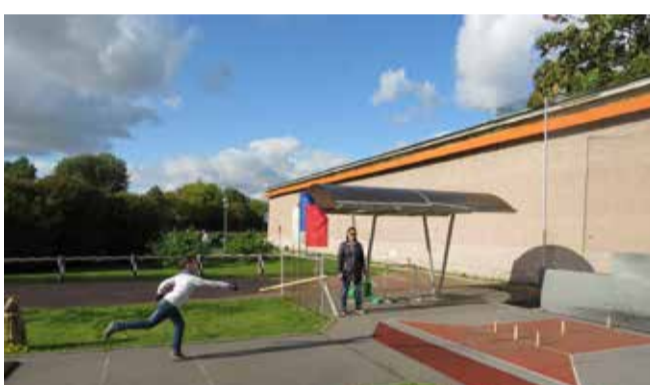
Соревнования по городошному спорту

лярным занятиям физической культурой и спортом, пропаганды здорового образа жизни. Участниками программы в 2019 году стали 865 человек.