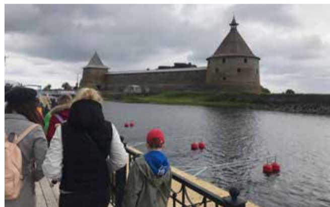
Экскурсия «Крепость Орешек»

2 апреля местная администрация МО МО Дворцовый округ совместно с ГУ МВД провела акцию «Сообща, где торгуют смертью». По телефону горячей линии ГУ МВД