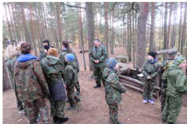
Военно-патриотическое мероприятие «Зарница»

В 2019 году собрана информация об иностранных гражданах, зарегистрированных на территории МО МО Дворцовый округ. Сбор информации проводился в рамках взаимодействия с органами государственной власти Санкт-Петербурга, ГУ МВД РФ по Санкт-Петербургу и Ленинградской области. На территории округа зарегистрировано по виду на жительство 52 чел., зарегистрировано на основании разрешения на временное проживание 12 чел.