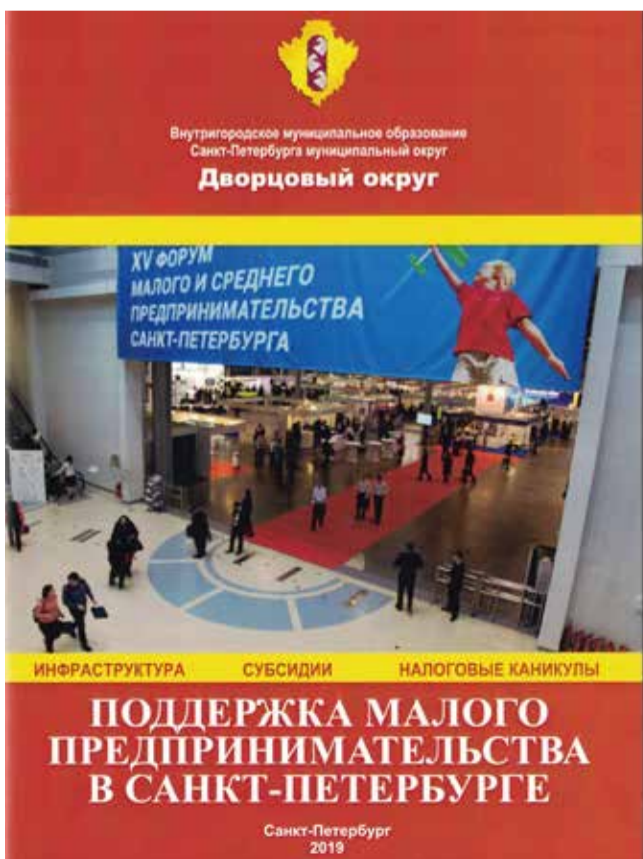
Брошюра с информацией для субъектов малого бизнеса