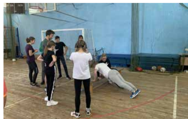
Муниципальные соревнования по ОФП «Кубок округа»

Программа направлена на информирование населения о деятельности органов местного самоуправления. В рамках программы выпущено 24 основных номера газеты «Дворцовый округ». В ней размещалась информация о мероприятиях, проводимых муниципалитетом, вы-