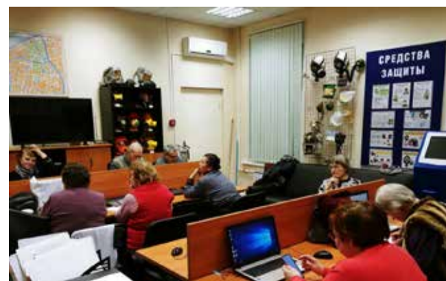
Занятия в учебно-консультационном пункте по гражданской обороне и чрезвычайным ситуациям