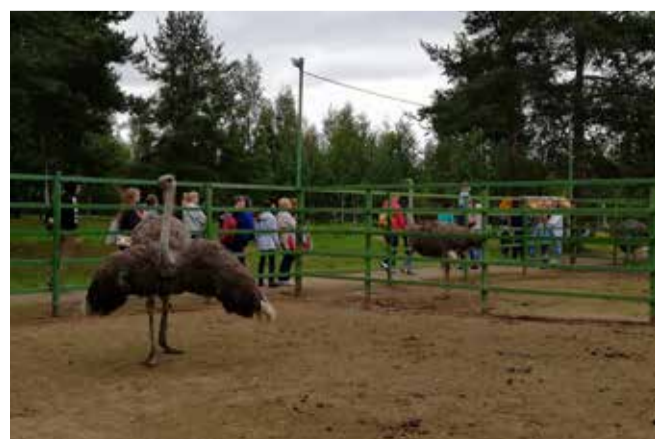
Экскурсия на страусиную ферму

• газета «Дворцовый округ» № 8 (апрель) «Весенний призыв: правила и проблемы», «Присоединяйтесь к акции!»;