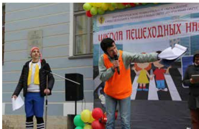
«Школа пешеходных наук»

Основное место в мероприятиях программы отведено информированию населения. Сотрудники местной администрации на постоянной основе участвовали в заседаниях комиссии по обеспечению безопасности дорож-