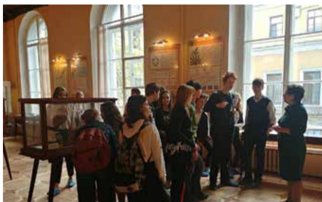
Экскурсия в музей гигиены