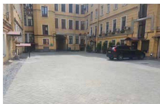
Миллионная ул., д. 29