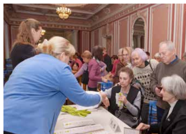
Выдача памятного знака «В честь 75-летия полного освобождения Ленинграда от фашистской блокады»