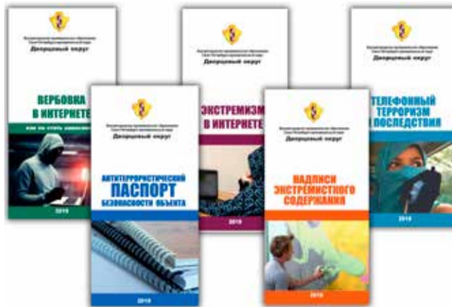
Евробуклеты по профилактике терроризма и экстремизма

11 декабря в актовом зале ГБУ СОШ № 222 состоялась церемония награждения победителей конкурса. В ней приняли участие глава местной администра-