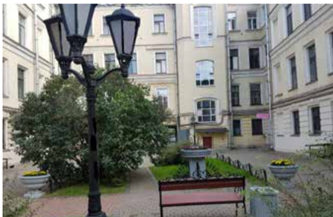
Итальянская ул., д. 31

Особое внимание уделялось приведению в порядок игровых площадок. На Итальянской ул., д. 31, наб. реки