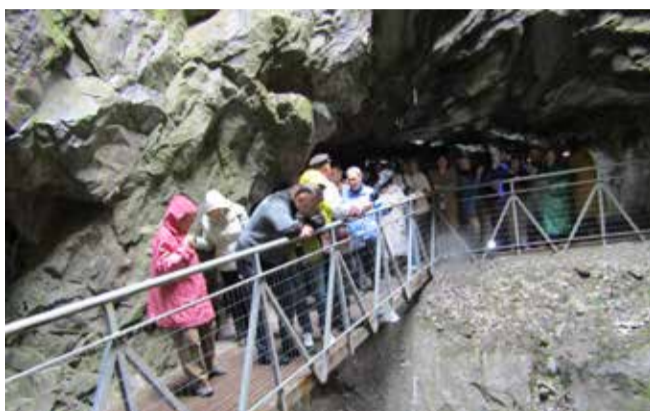
Экскурсия «Жемчужина Карелии — Рускеала»