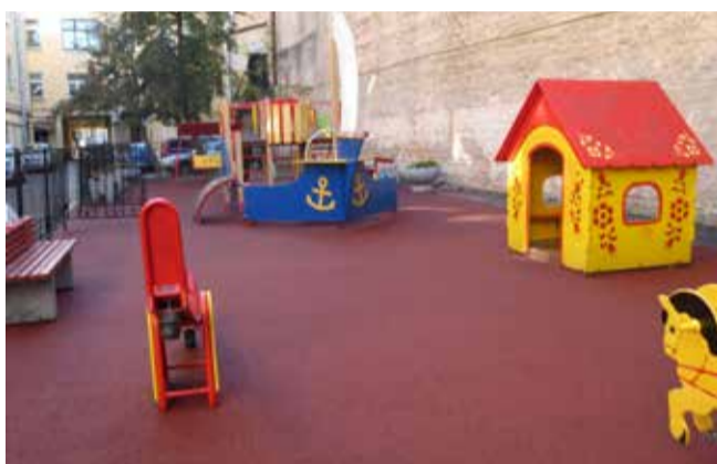
Б. Конюшенная ул., д. 7