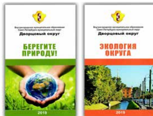
Евробуклеты по охране окружающей среды