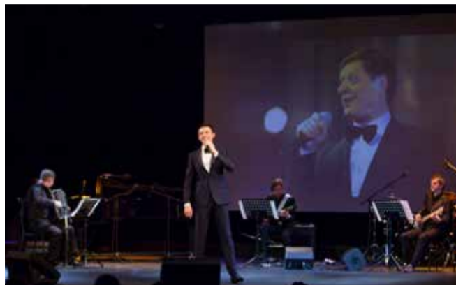
Концерт «Ты — моя мелодия»