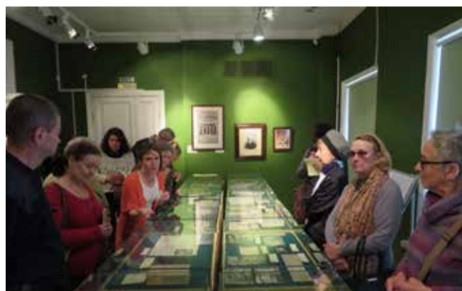
Экскурсия в Музей-квартиру А. А. Блока