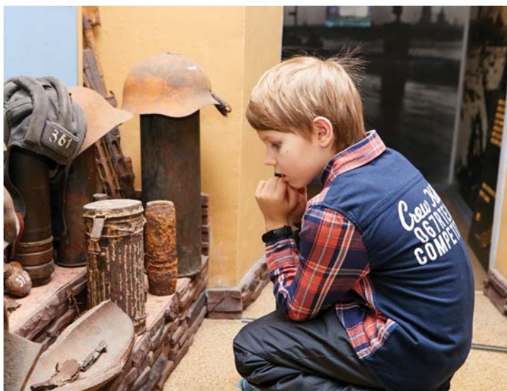
Коллекция музея вызывает неподдельный интерес у детей

Дмитрий Полянский