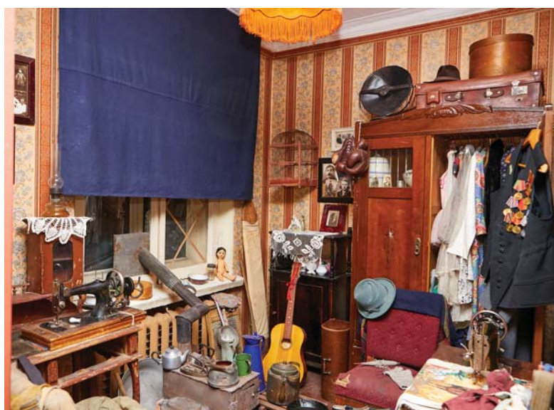
Такие экспонаты есть не в каждом музее!

Нехватка материалов, изобретательность изголодавшихся людей и научный поиск породили ряд изобретений. Так, именно в блокадном городе педиатр придумал соевую детскую смесь, таким способом выкармливания малышей мы пользуемся по сей день. «Книжки-малышки» — тоже ленинградское явление, порожденное необходимостью экономии бумаги и типографской краски.