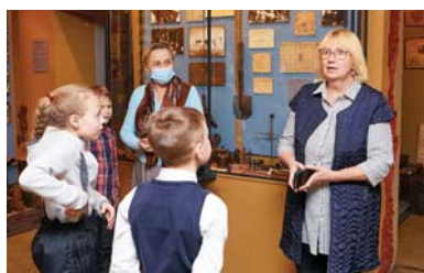
Школьные годы... военные