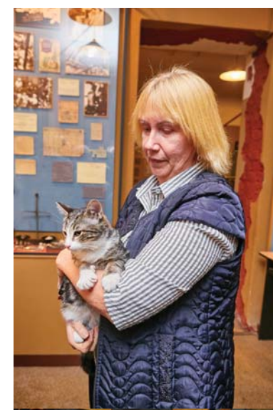
Житель музея — котенок Пятачок

Во Всеволожском районе с 1942 года были обустроены летние пионерские лагеря. Школьники занимались сельским хозяйством, обеспечивали город овощами, заготавливали сено, помогали ухаживать за коровами, привезенными с Большой земли. Музей хранит книжку молодой мамы, по которой на специально организованных молочных кухнях выдавали молоко. Дети собирали ягоды и грибы, заготавливали березовые листья на махорочную смесь фронтовикам, сушили мох для госпиталей как антисептическое и кровоостанавливающее средство. Зимой ребята трудились в госпиталях: стирали бинты, убирали палаты,