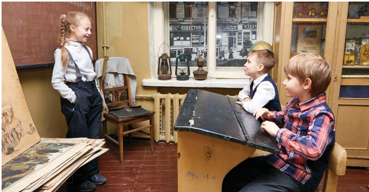
Современным школьникам нравится посидеть за партами 1940-х годов

12 февраля для жителей Дворцового округа, взрослых и детей, состоялась экскурсия в музей «Юные участники обороны Ленинграда», действующий в школе № 210. Это единственный в Петербурге музей, посвященный школьникам блокадного города.