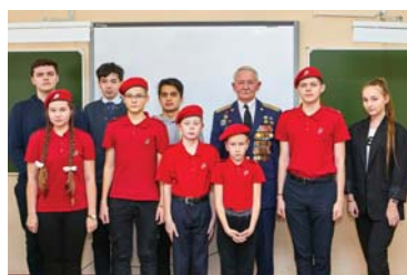
Боевое братство «афганского десятилетия»