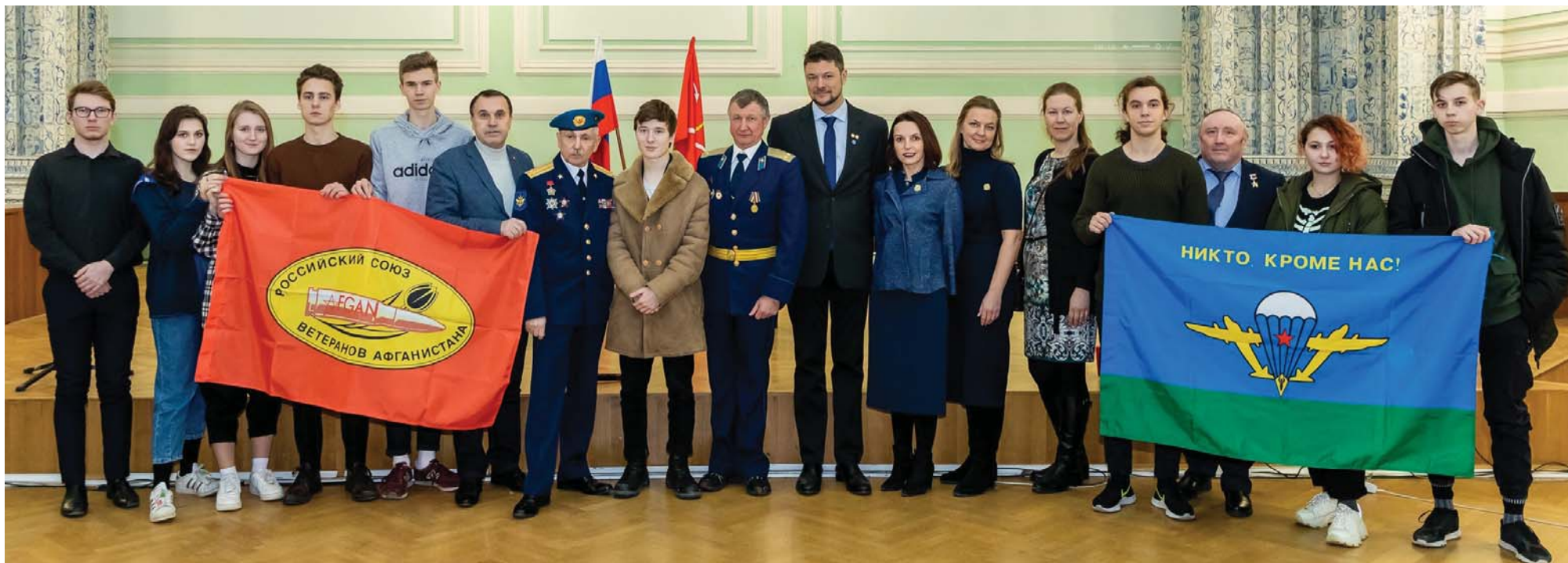
Руководители фонда «Возрождение» и МПД «Гвардия» при участии администрации школы и МО Дворцовый округ провели Урок мужества в школе № 222