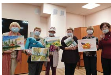
КЦСОН стал палочкой- выручалочкой для жителей