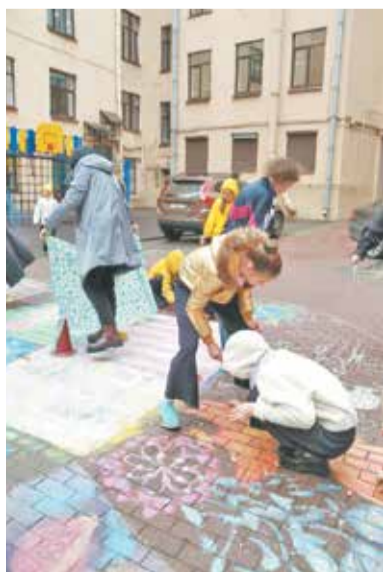
Поколение XXI века за работой

Ученики школы № 210 постигают теорию культуры, занимаются творчеством. Особое место в работе школы занимает сотрудничество с Русским музеем, Государственным Эрмитажем, Государственным музеем-памятником «Исаакиевский собор». Ребята участвуют в выставках, оформляют арт-пространства, побеждают в городских и межрегиональных конкурсах проектной деятельности.